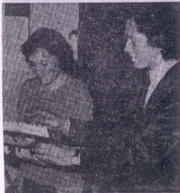
Een krulset voor de opstel-schrijfster.